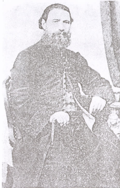
PĂRINTELE RADU POPEEA, FOST TRIBUN PE TÂRNAVE ÎN REVOLUȚIA DE LA 1848. A PREOȚIT LA BISERICA SF. ADORMIRI DIN SATULUNG ÎNTRE 1850 ȘI 1900.