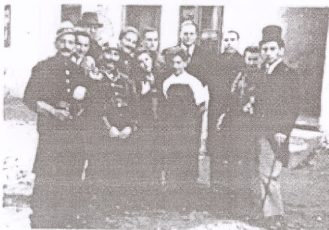
Spectacolul cu piesa „O noaptea furtunoasă” de I.L. Caragiale prezentat de Cercul de teatru al Casei de citire de la Biserica Sfinții Arhangheli Satulung.

Dacă în parohia „Sfintei Adormiri” din Satulungul „de sus” tinerii au cunoscut pe lângă activitatea culturală și o viguroasă componentă sportivă, prin accentuata preocupare pentru fotbal și schi, în parohia „Sfinții